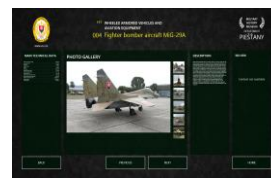
Applikation entwickelt für große Touchscreens. Windows platform, installiert in dem Militärmuseum in Bratislava.