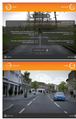
Applikation für iPad angewendet beim Lernen von Theorien im Verkehr.